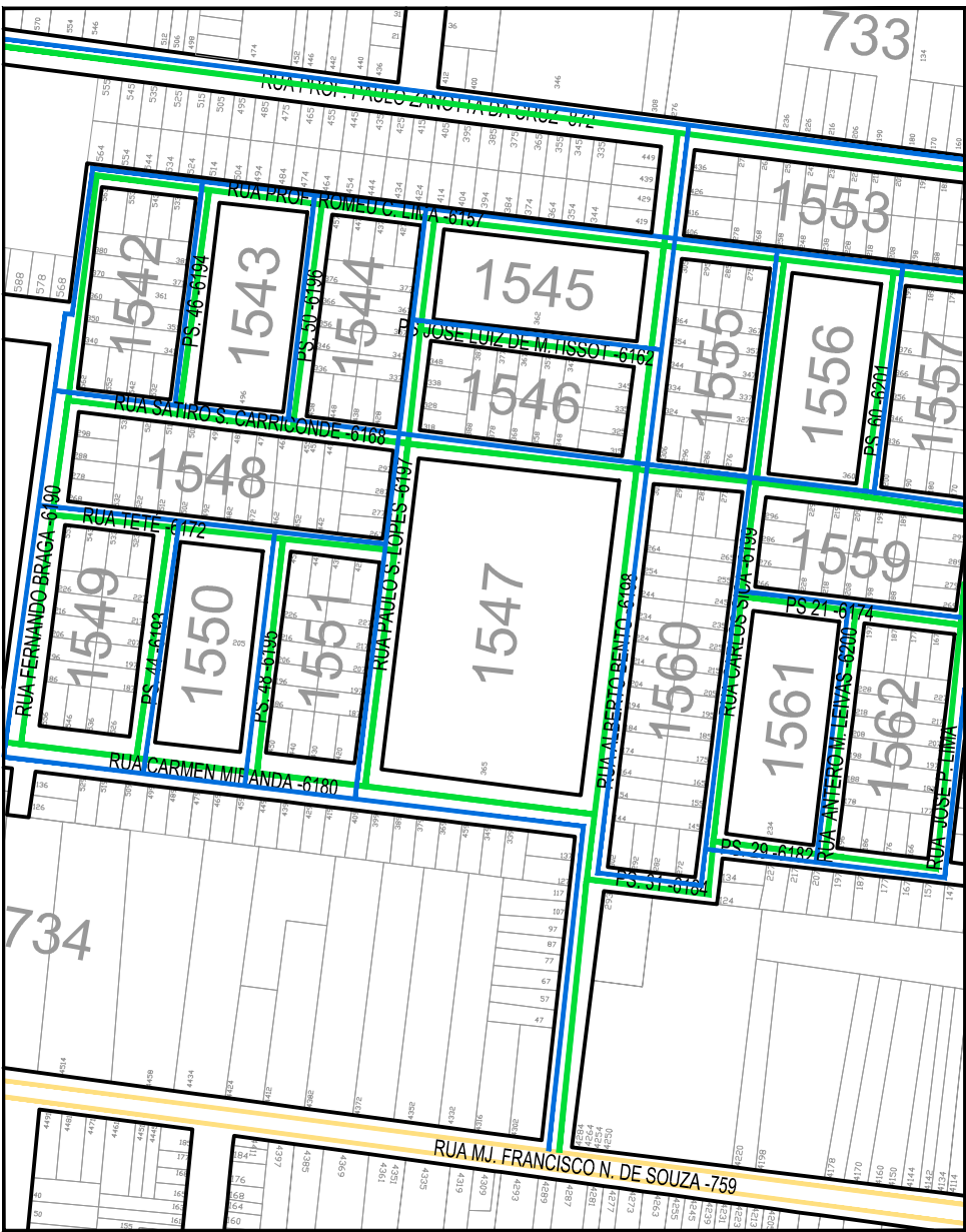
4 PLANTA DE REDES DE ÁGUA E ESGOTO - SANEP Escala 1:1000

DADOS: LARGURA: 8,90 M COMPRIMENTO= 292,00 M ÁREA A SER PAVIMENTADA = 2.741,63 m 2 PAVIMENTO PROJETADO = CBUQ