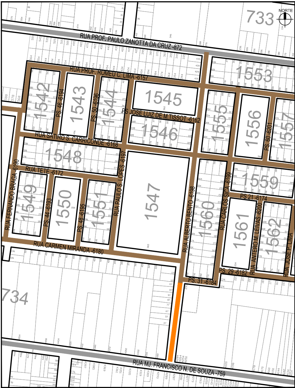
3 PLANTA DE IDENTIFICAÇÃO DOS TRECHOS E TIPO DE PAVIMENTAÇÃO Escala 1:1000